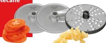
plaster 1,5 mm (cebula, pieczarki) - 0009648 plaster 4 mm (pomidory, papryka) - 0009657 wiórki 8 mm (ser) - 00009197